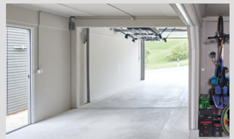
Einzigartige Durchfahrtshöhe von 2.12 m

*beinhaltet Online-Katasterplan & Garagenpläne