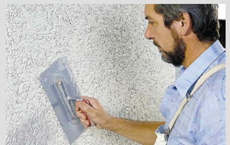
Aussenverputz von Hand aufgebracht, Körnung 1.5 mm