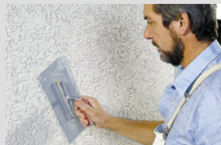
Aussenverputz von Hand aufgebracht, Körnung 1.5 mm