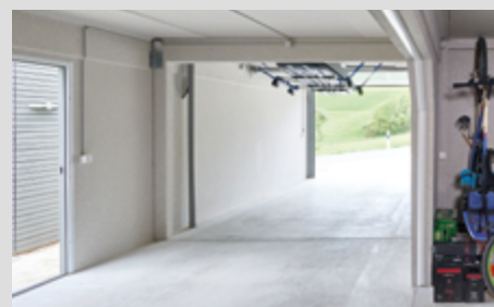
Einzigartige Durchfahrtshöhe von 2.12 m

*beinhaltet Online-Katasterplan & Garagenpläne